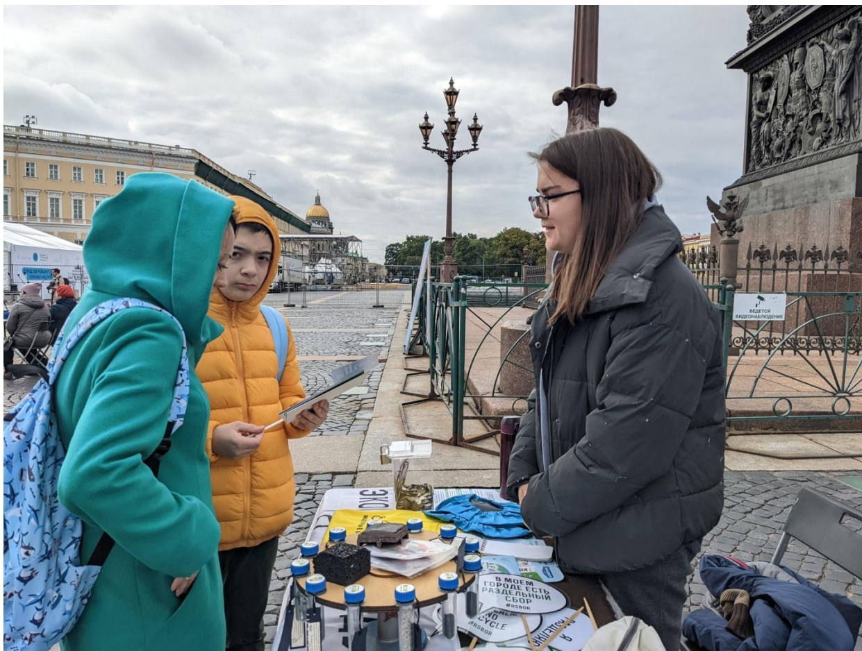
18.09.2022. «Раздельный Сбор» на городском празднике День хранителей Петербурга.