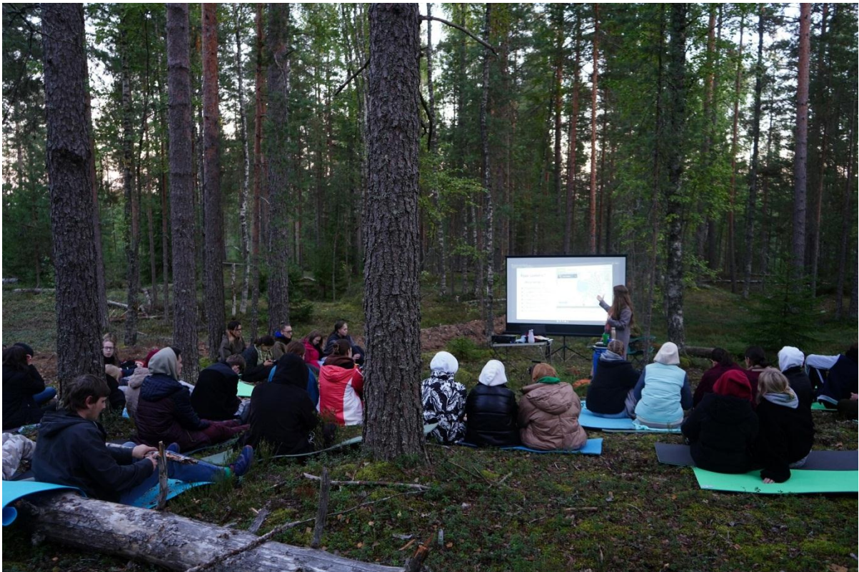
Лекция на экологическом слёте эковолонтеров «Green days» от БГТУ «Военмех» им. Д.Ф. Устинова

Лекции о раздельном сборе прошли на фестивале Full Moon Systo Togethering 2022 (09.09.2022), на фестивале ITMOGreen (07.09.2022), а также в рамках экологического слета эковолонтеров «Green days» от БГТУ «Военмех» им. Д.Ф. Устинова (10.09.2022).